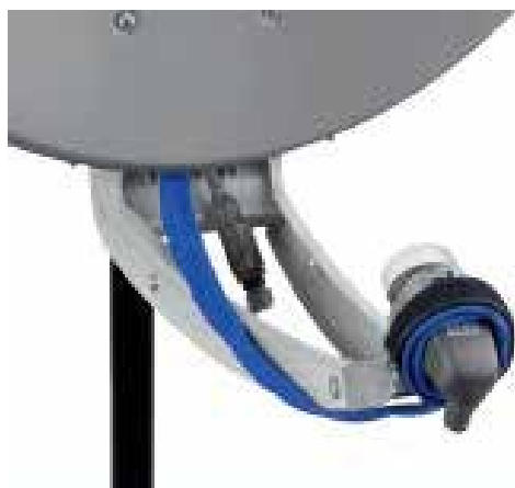
BANDA FLEXIBILA PENTRU DISPOZITIVUL DE ALIMENTARE AL ANTENEI