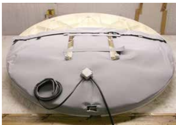
TERMOCOPERTA INSTALATA PE DISCUL ANTENEI