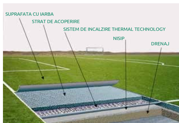
STRATIFICAREA UNUI TEREN CU INCALZIRE