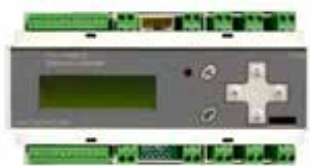
UNITATE ELECTRONICA DE CONTROL A TEMPERATURII T705